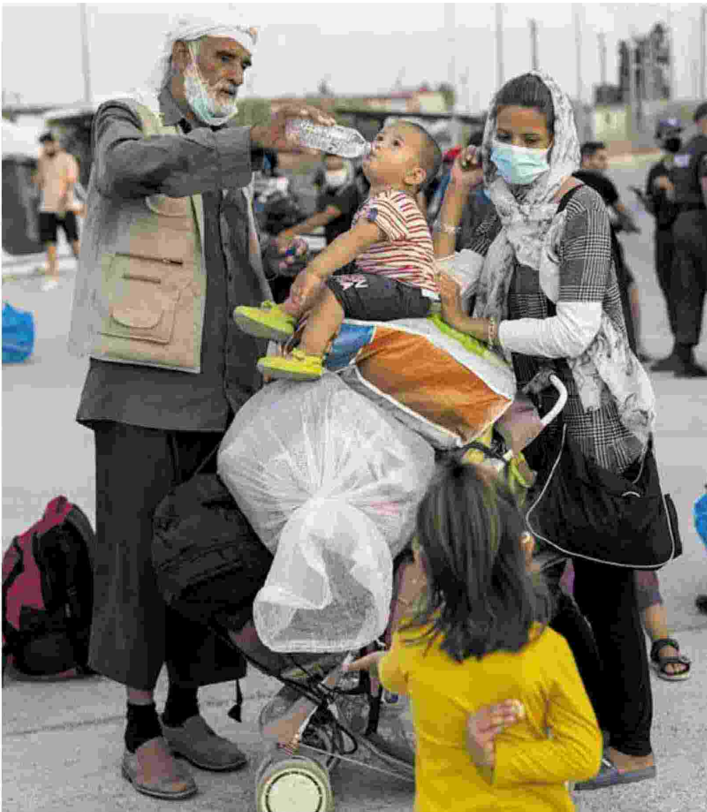
Isola di Lesbo, Grecia. Famiglia di rifugiati afgani dopo l'incendio che ha distrutto il campo di Moria

QUANTO AI PATTI con l'Unione europea, per lui «non c'è differenza tra i due accordi». Ci fornisce numeri ufficiali sugli afgani rimpatriati dall'Europa. «Nel corso di quest'anno, finora 24 persone sono ritornate volontariamente dall'Europa, mentre i rimpatriati sono 272». Impossibile prevedere quanti lasceranno il Paese. «Ma saranno tanti».