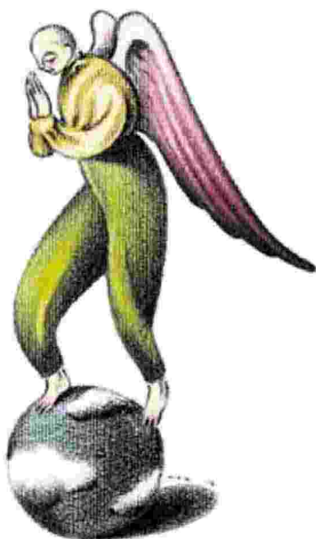
«Rullante» ill. di Pedro Scassa

Una sinistra cinica e autoritaria è una sinistra subalterna che nega la sua stessa natura; per il potere in tutte le sue forme, compreso quello liberale e democratico